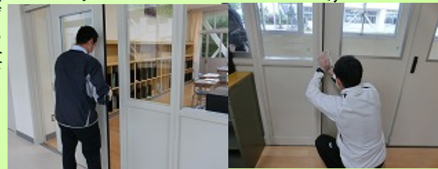
きれいに清掃 水拭きで仕上げ